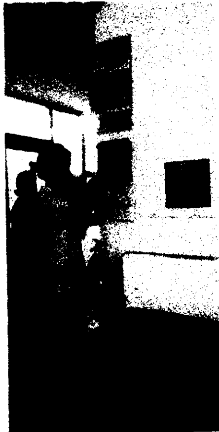
ภาพการเปิดคู่มือเรื่องร้องเรียน - ร้องทุกข์ ทุกวันพุธเวลา 14.30 น.